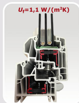
Refuerzo con RPT

Las especiales características de la Ventana RE 70/PVC/300 : Triple junta y opción de doble vidrio con una cámara ó triple vidrio con dos cámaras , junto a la sección de sus perfiles (marco de 70 mm. y hoja de 80 mm.) y sus sistemas de herraje, la convierten sin duda en una VENTANA EXCELENTE con unos niveles de transmitancia térmica, atenuación acústica, permeabilidad al aire, estanqueidad al agua y resistencia a la carga de viento realmente extraordinarios.